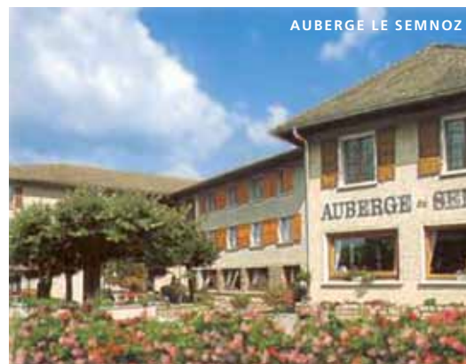
AUBERGE LE SEMNOZ

Voor de middag richting Dijon. Vrij middagmaal in een snelwegrestaurant. Aansluitend naar Groot-Bijgaarden.