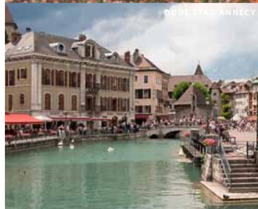
OUDE STAD ANNECY