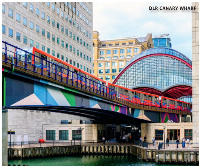
DLR CANARY WHARF